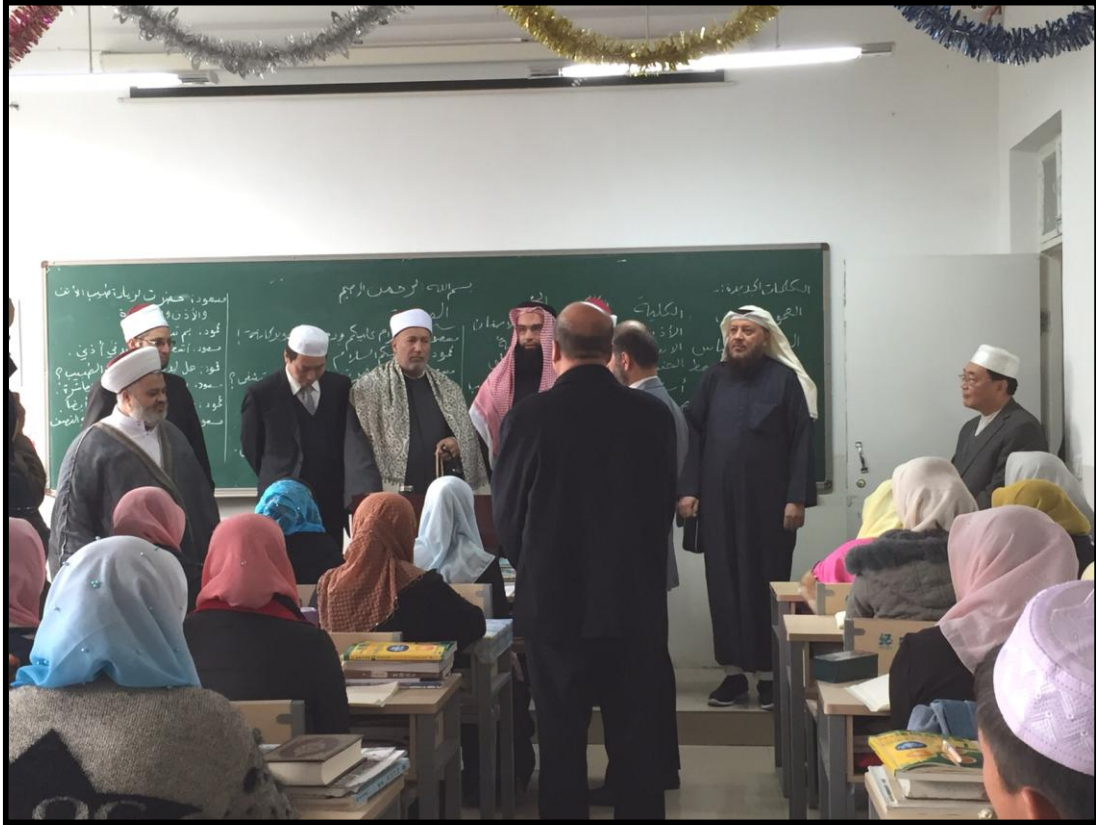
زيارة أحد الفصول الدراسية في المعهد الإسلامي بولاية نينغشيا