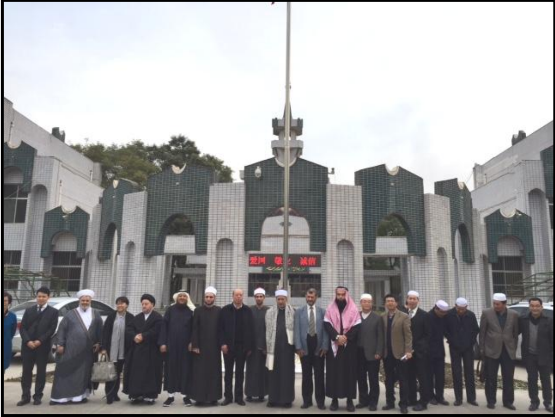
صورة جماعية مع الموفد امام المعهد الاسلامي بولاية نينغشيا