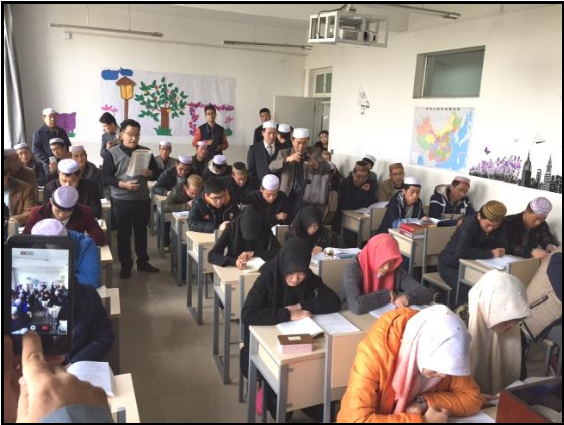
أحد الفصول الدراسية بالمعهد الاسلامي