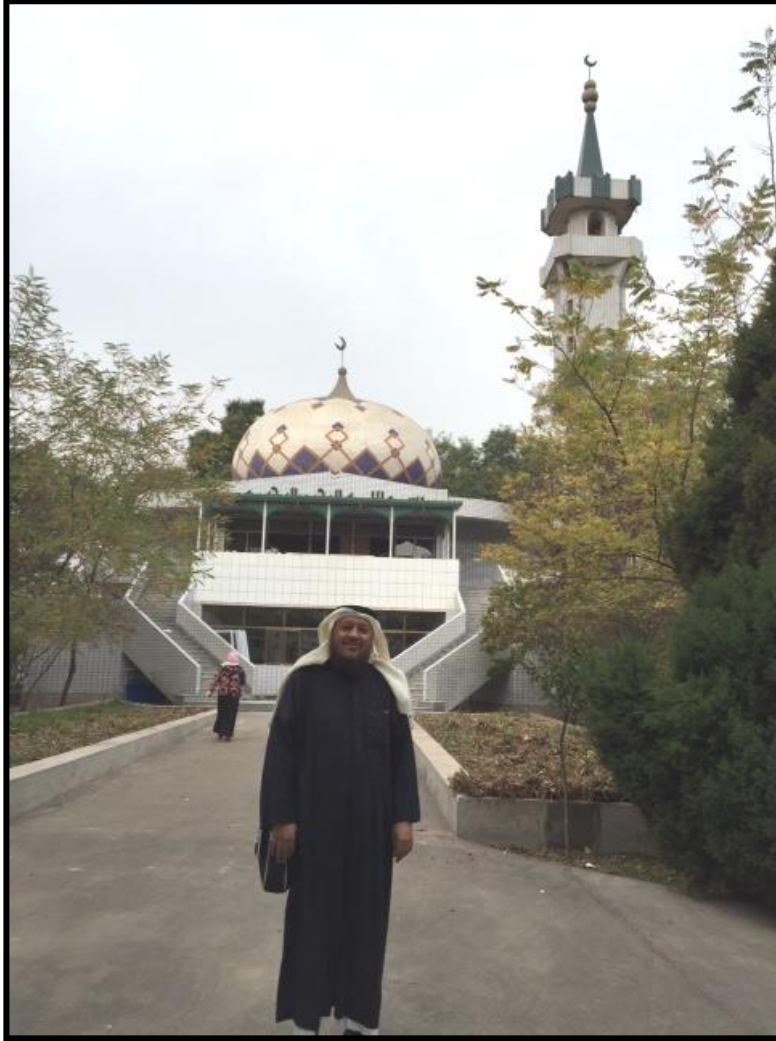
أحد المساجد بالصين