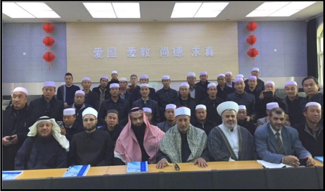
قاعة تدريب الائمة بأحد المعاهد الاسلامية بالصين