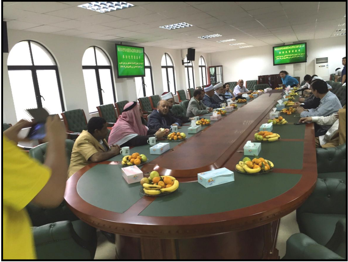
أحد الاجتماعات مع الجالية العربية بولاية قوانغ تشو