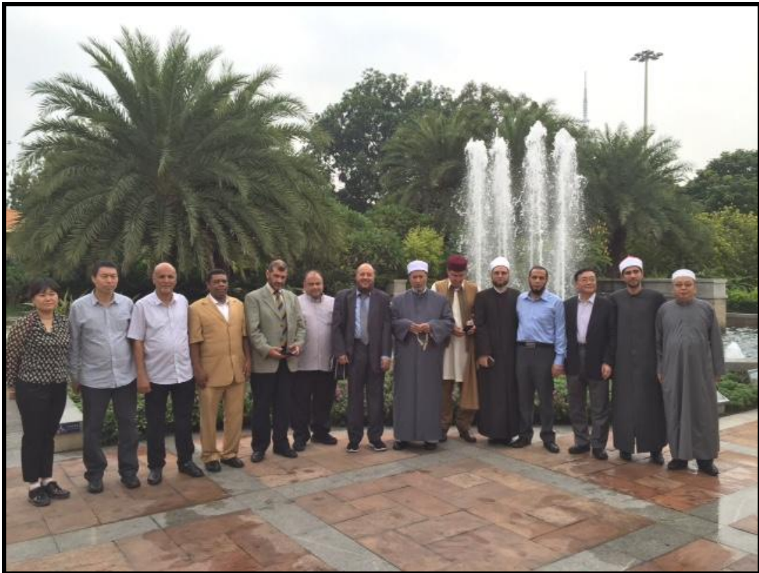
لقطة جماعية مع الجالية العربية