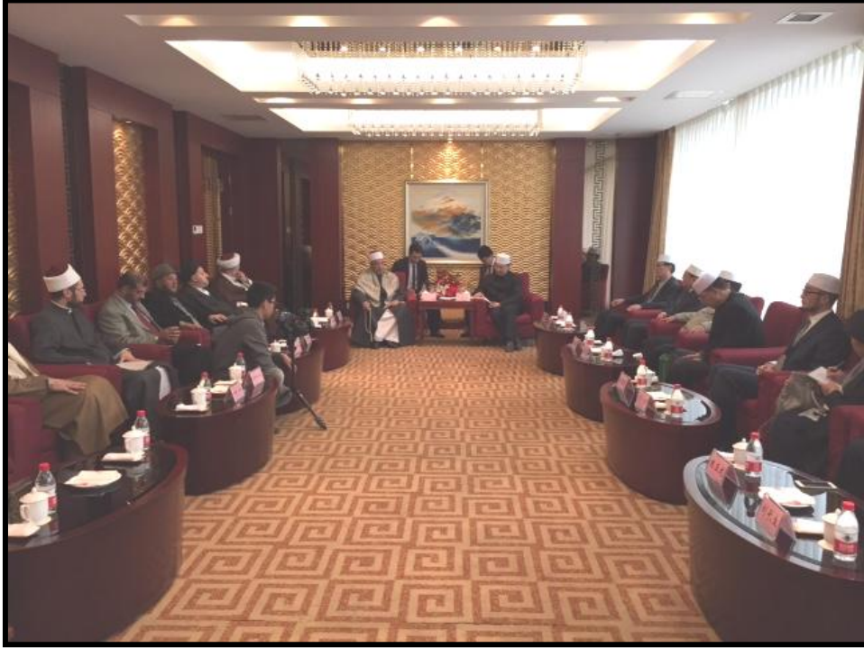
لقاء الوفد العربي الاسلامي مع بعض الشخصيات الاسلامية بالصين