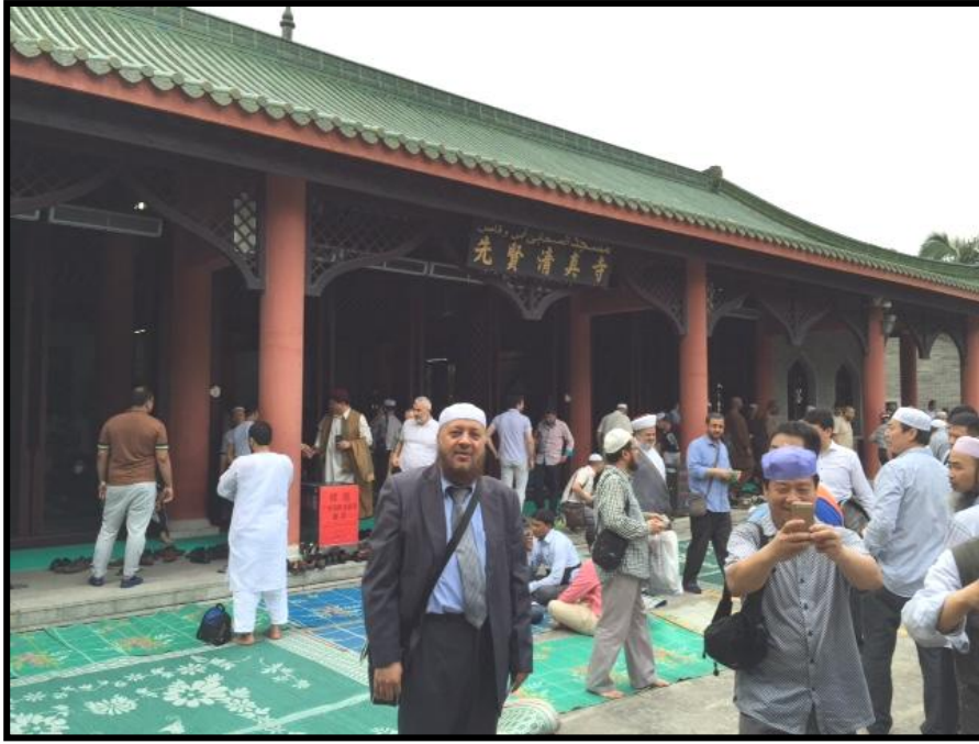
بعد صلاة الجمعة بمسجد أبي وقاص بولاية قوانغ تشو