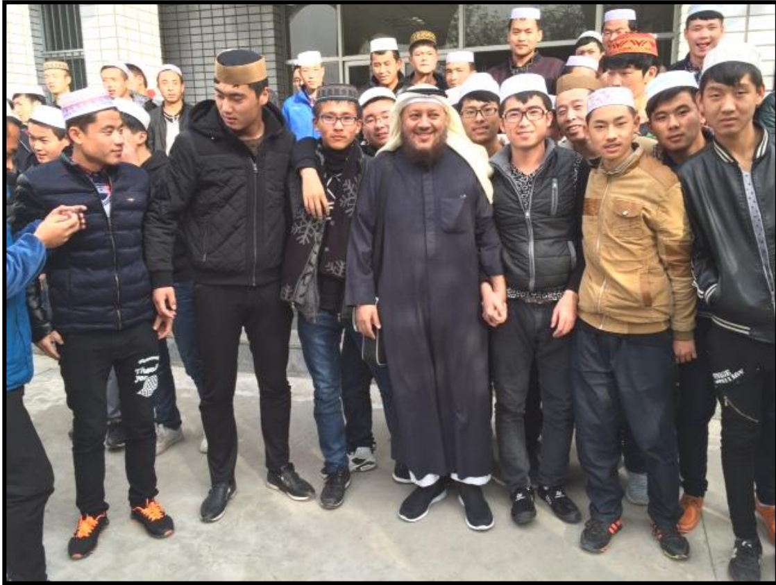
المعهد الإسلامي بولاية نينغشيا بالصين ذات حكم مستقل وحاكمها مسلم