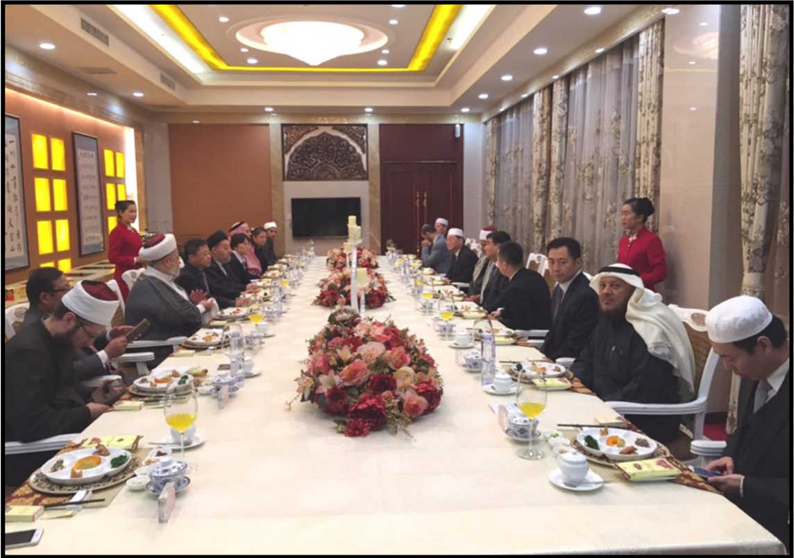
مأدبة عشاء مع نائب الحاكم بولاية نينغشيا ولقاء بعض المسؤولين