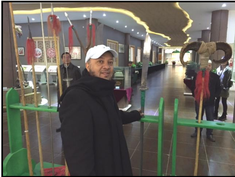
زيارة متحف بولاية نينغشيا