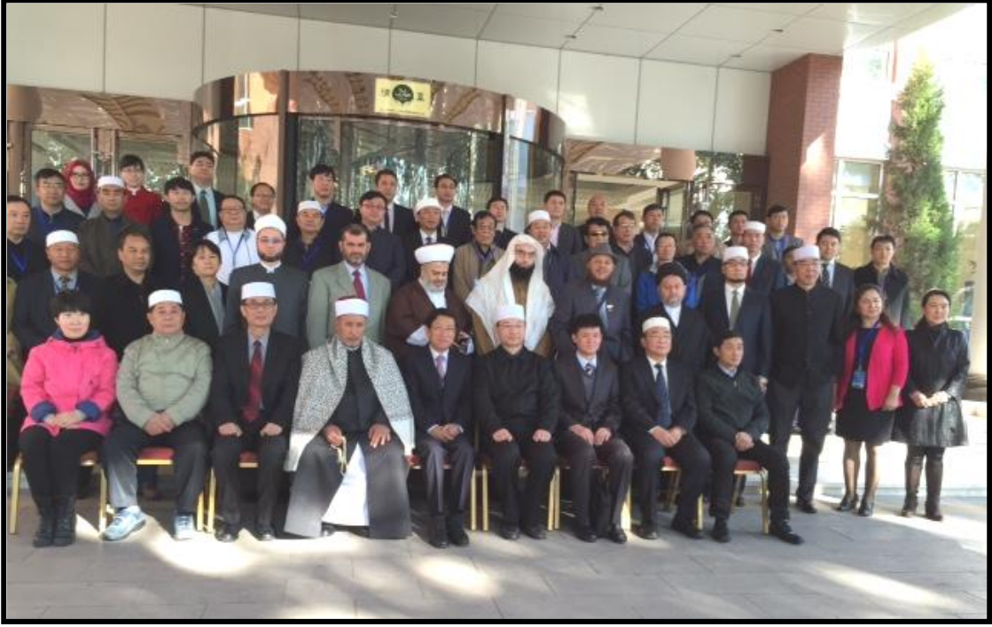
صورة جماعية مع أعضاء المؤتمر المنعقد ببكين حول طريق الحرير