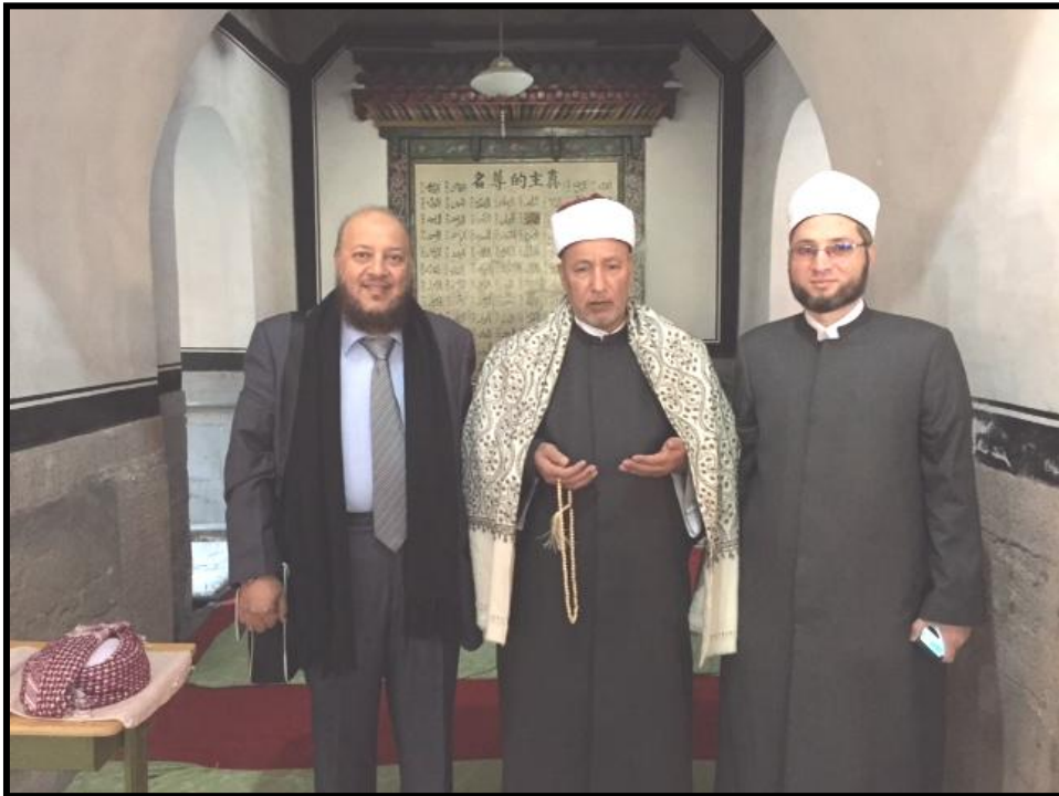
داخل أحد المساجد مع رئيس الوفد العربي بالأزهر الشريف