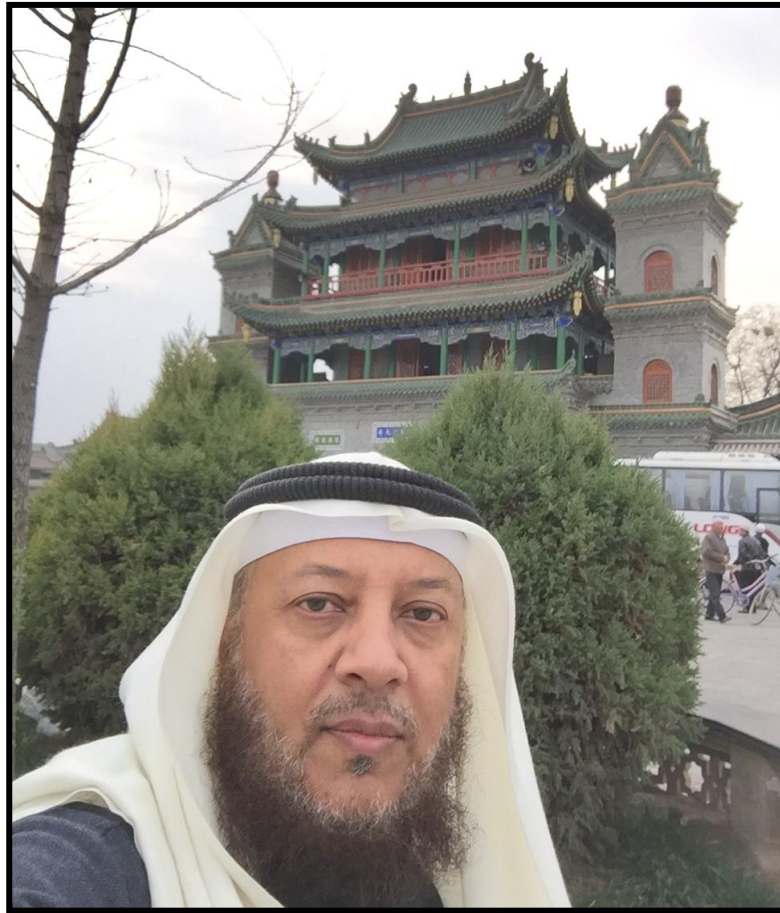
مسجد قديم عمره 500 عام بولاية نينغشيا الصينية