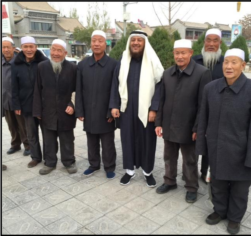
مع رواد أحد المساجد بولاية نينغشيا