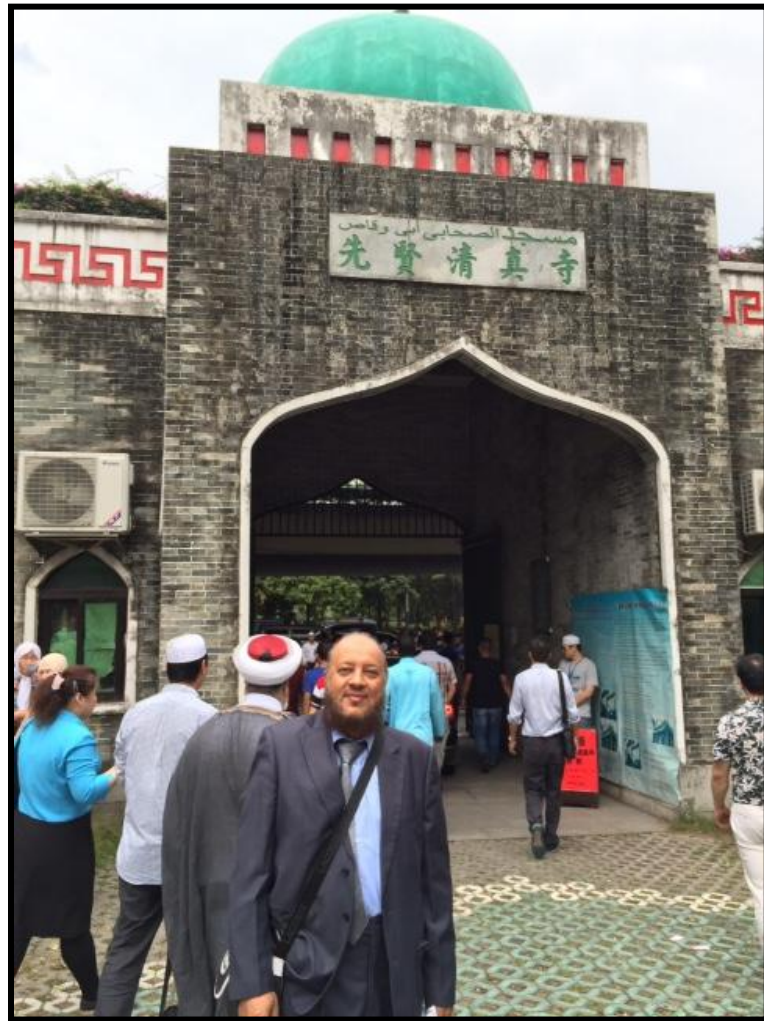
مسجد أبي وقاص بولاية قوانغ تشو