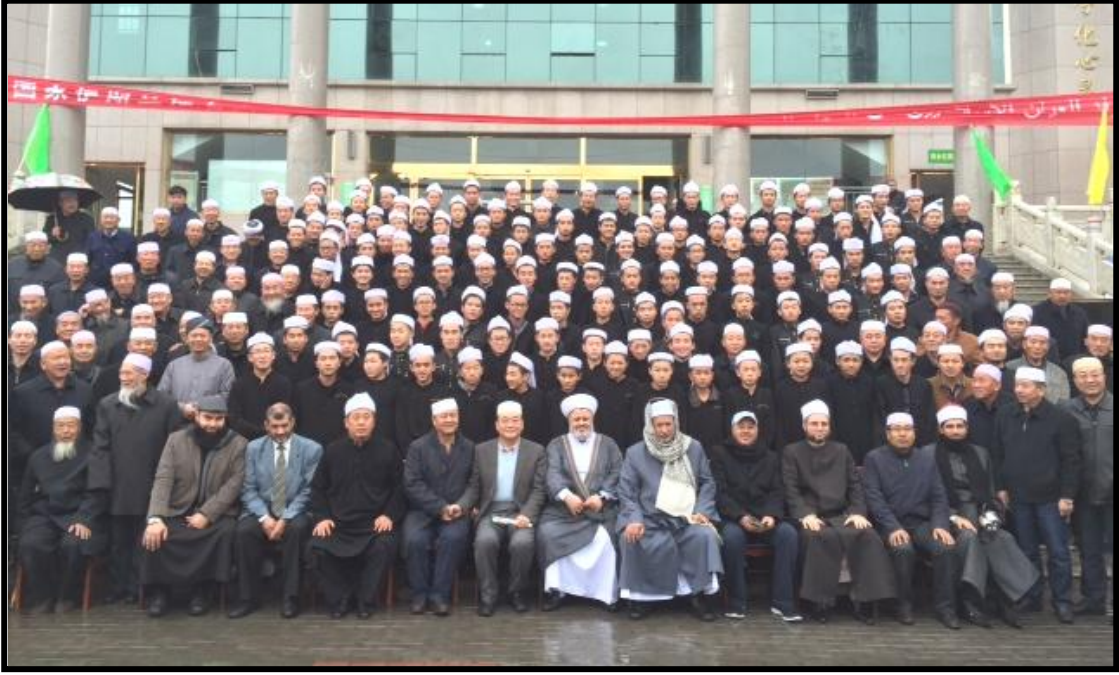
صورة جماعية مع طلبة ومدرسي وائمة مسجد ومدرسة تنكا بولاية قوانجو