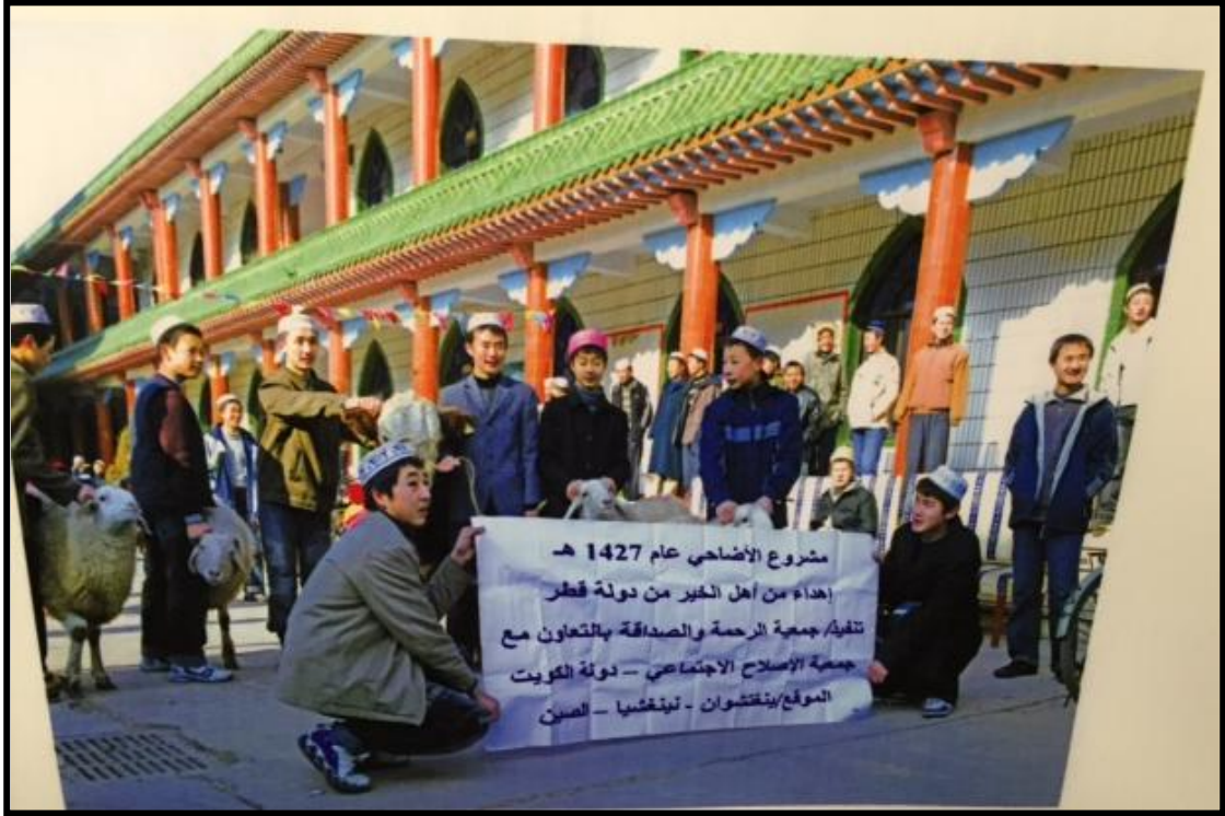
ترحيب طلاب المعهد الإسلامي بالوفد العربي